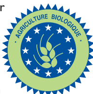
logo européen pour les produits biologiques