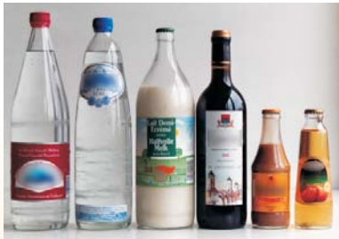
Limonade, eau, lait, vin et bière.

Les bouteilles consignées ne génèrent aucun déchet d'emballage à la maison puisqu'on les ramène au magasin contre remboursement.